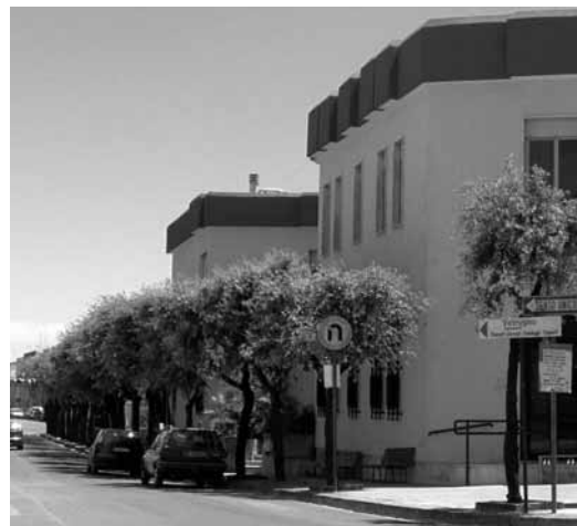
Veglie, il palazzo municipale

sono interessati a presentare la loro candidatura al fine di predisporre l'elenco degli aspiranti al ruolo di difensore civico (...).