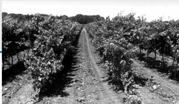
Un vigneto di Negroamaro

già all'origine. Nella Viticoltori, ad esempio, sono operativi già tre scari per le uve (e se ne prevede la costruzione di un altro), mentre nello stabilimento di via Fratelli Bandiera ne esistono solo due. Secondo il progetto di fusione, dunque, quest'ultima struttura, sarà quella destinata ad essere alienata. Con parte