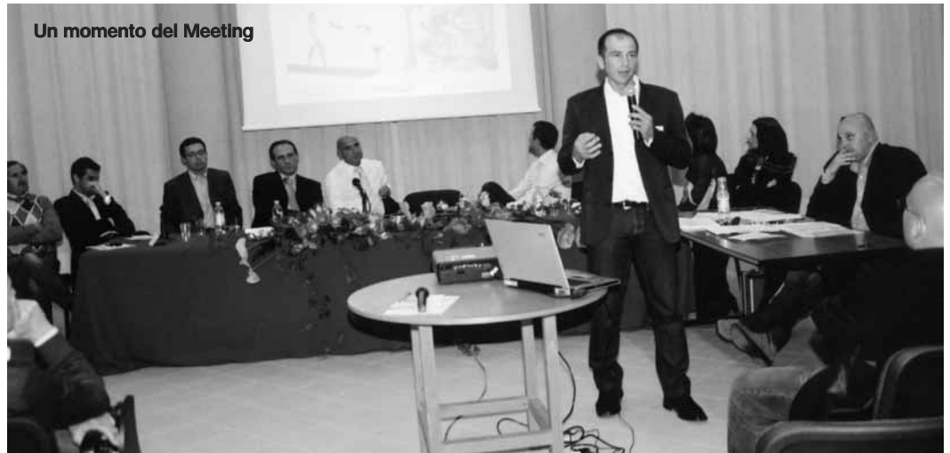
Un momento del Meeting

All'appuntamento ha partecipato il ciclista Maurizio Fondriest, campione del mondo nel 1988 a Renaix