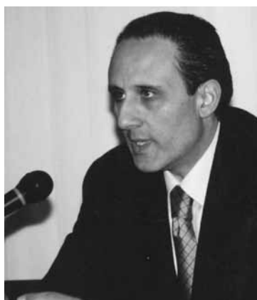
Il sindaco Fernando Fai

- a tale fine il presidente dell'Unione provvede, mediante avviso pubblico, a invitare coloro che