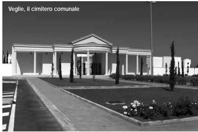
Veglie, il cimitero comunale

che curi e sovrintenda l'organizzazione di tutte le procedure dei servizi cimiteriali e delle attività