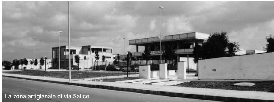
La zona artigianale di via Salice